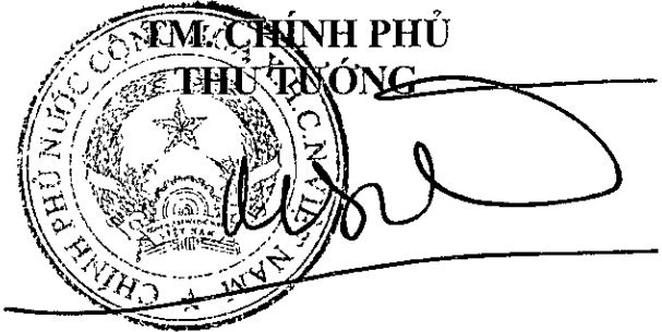
Phạm Minh Chính